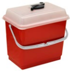
Cubo 4 L con tapa